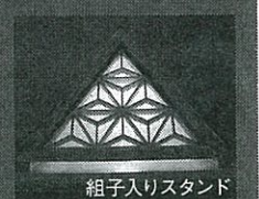
組子入りスタンド